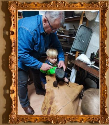
Żywa lekcja historii dla grupy przedszkolaków z drawskiego przedszkola. Warsztat szewski.