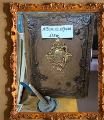
Album na zdjęcia XIX.