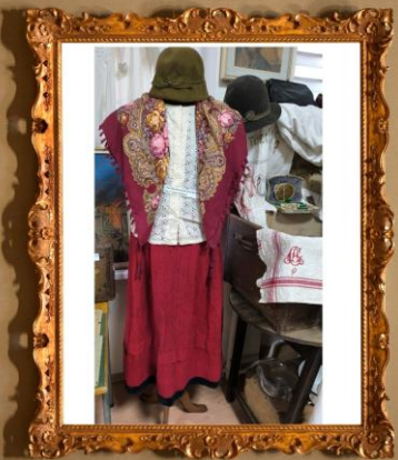
Ubiór byłej mieszkaneki Drawskiego Pomorskiego, okres II wojna światowa.