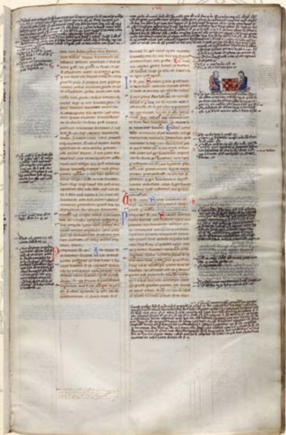
XIII-wieczny Kodeks Justyniana z miniaturą przedstawiającą scenę gry w szachy