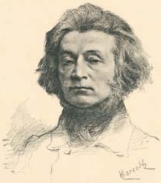
ADAM MICKIEWICZ 1798-1855