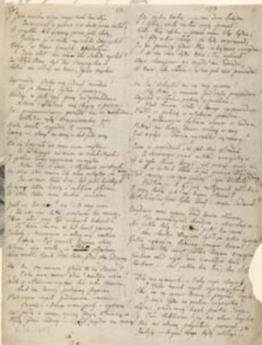
rękopis /Beniowskiego/ Juliusza Słowackiego