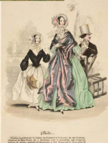
Journal des Dames et des Modes (XIX w.)